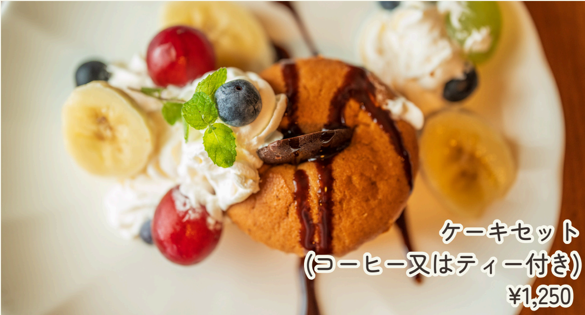
ケーキセット (コーヒー又はティー付き) ¥1,250